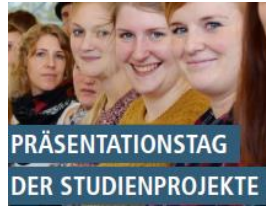
Plakat-Ausschnitt für den Präsentationstag

Vermutlich waren die beteiligten Dozierenden auch aufgeregt. Die 30 präsentierenden Studierenden waren es auf jeden Fall, als sie am 27. November Ergebnisse ihrer Studienprojekte aus dem Praxissemester im Repräsentationsaal in der Klosterstraße präsentierten. Es war die erste Studierendengruppe, die das Praxissemester abge-