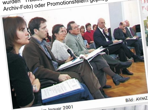
Fakultätstage im Januar 2001

↓ Aus: Newsletter 2001/0 In der ehemaligen Heilpädagogischen Fakultät wurden Traditionen wie Fakultätstage (siehe Archiv-Foto) oder Promotionsfeiern gepflegt.