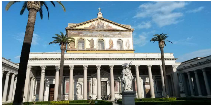
Basilica San Paolo.

Meine Lieblings-Monumente sind das Pantheon (vor allem bei Dämmerung!) und das Colosseo Quadrato im EURViertel. Die schönste Kirche ohne Touristenströme ist die Basilica Sant Paolo etwas außerhalb vom Zentrum. Generell bin ich besonders gern abends oder nachts durchs Centro gelaufen, wenn fast nur noch Römer unterwegs sind und die Stadt etwas abgekühlt ist.