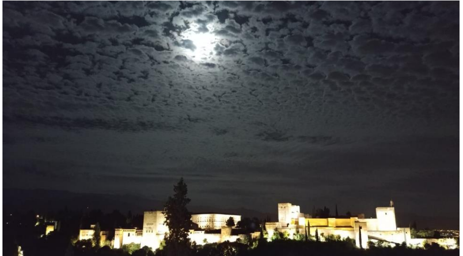
1 Die Alhambra bei Nacht

Ich wusste bereits vor Studienbeginn, dass ich sobald wie möglich ein Erasmus- Auslandssemester machen wollte. Dementsprechend habe ich alle erforderlichen Dokumente vorbereitet und zum erstmöglichen Termin als Bewerbung eingereicht. Ich hatte mich aus persönlichen und vor allen Dingen sprachlichen Gründen heraus für Südspanien, genauer Andalusien, entschieden und somit drei Andalusische Städte als Wünsche angegeben. 1. Málaga, 2. Murcia, 3. Granada. Als es dann meine Drittwahl wurde, war ich anfangs etwas enttäuscht, kann aber im Nachhinein nur sagen, Granada ist mit Abstand die beste Stadt für ein Auslandssemester.