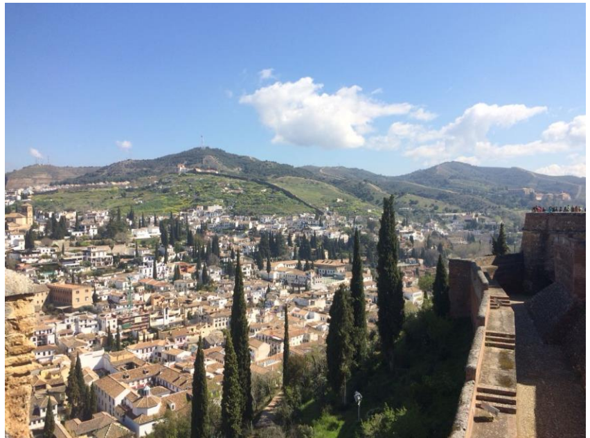
3 Granada von der Alhambra aus

de Educación , die sich auch in Cartuja befindet. Man kommt mit dem Bus, auch wenn er morgens sehr voll ist, entspannt dort hin. Die Preise für die einzelnen Busfahrten sind dem Alter des Studierenden angepasst. Die Grenze liegt bei 25 Jahren. Ab diesem Alter zahlt man mehr als die jüngeren Studierenden und kann den Studierendenausweis nicht mehr als Ticket benutzen. Deshalb bin ich morgens mit dem Bus hochgefahren und nachmittags zu Fuß zurück gelaufen. Insgesamt habe ich in dem einen Semester ca. 40-50 Euro für Bustickets ausgegeben.