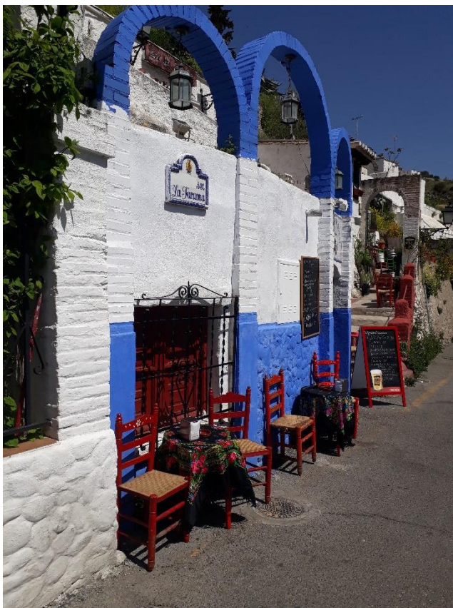
4 Sacromonte das "Zigeunerviertel"

Die Cafeteria der Fakultät ist laut, manchmal etwas chaotisch und einfach nur nett. Die Mitarbeiter sind herzlich und offen, helfen einem beim Spanischsprechen und auch bei sonst allem was so anliegt. Das Essen ist günstig und gut. Die Auswahl ist für eine Cafeteria zwischen warmen Gerichten, Sandwiches und Salaten ausreichend. Zu jedem Getränk gibt es eine Tapas, die man extra bestellen muss und im Innenhof gibt es immer ein Fleckchen Sonne. Hier trifft man sich zum Frühstück und Mittagessen, mit Kommilitonen und Dozenten, alle sitzen zusammen. Oft macht jemand Musik mit der Gitarre oder es läuft Musik über einen Lautsprecher. Die Stimmung ist ausgelassen und es lässt sich dort wunderbar aushalten. Zum Studieren sollte man daher besser in die Bibliothek gehen.