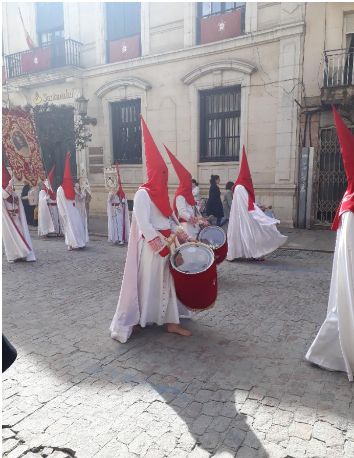
7 Semana Santa (Osterwoche) in Úbeda

Zusammen mit der Sierra Nevada würde ich die Osterwoche in Úbeda zu meinen Highlights des Semesters zählen. Úbeda liegt von Granada ca. 140 Kilometer entfernt. Die Stadt ist sehr klein und steht zusammen mit der Stadt Baeza auf der Liste des Weltkulturerbes der UNESCO.