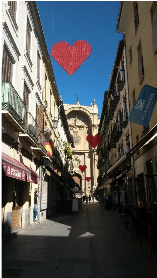
2 Die Kathedrale

In Spanien angekommen habe ich ein paar Tage in einem vorweg gebuchten Airbnb geschlafen und eine Wohnung gesucht. Airbnb-Wohnungen sind sehr günstig und leicht zu finden, jedoch hatte ich eine erwischt mit direkter Sicht nach draußen durch einen 3cm breiten Spalt zwischen Türrahmen und Hauswand. Man sollte also nicht allzu pingelig sein. Der Standard ist generell ein anderer, dementsprechend war ich anfangs etwas enttäuscht über die Auswahl der Wohnungen. Wichtig ist hier eine Heizung für die kalten Monate und am besten eine Klimaanlage für die heißen Monate. Beide Temperaturen können ins Extreme gehen. Die Wände sind bestenfalls aus Pappe, also wer geräuschempfindlich ist, wie ich, sucht sich besser ein Zimmer in den Innenhof oder eine Wohnung in einer ruhigen Gegend. Ich habe mich für den Innenhof entschieden und habe sehr gut geschlafen. Eine Wohnung findet sich wirklich schnell, man sollte allerdings darauf achten, dass man sich als „reicher“ Erasmus-Studierender nicht mit den Preisen übers Ohr hauen lässt und man kann sich ruhig ein oder zwei Wohnungen mehr anschauen. Die Auswahl ist sehr unterschiedlich. Ich kann nur empfehlen sich eine Wohnung mit spani-