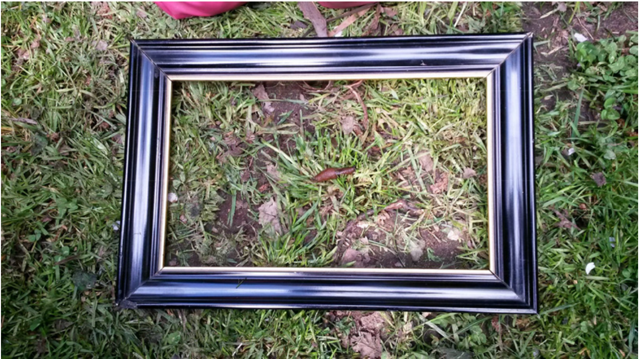
Portrait einer Nacktschnecke.