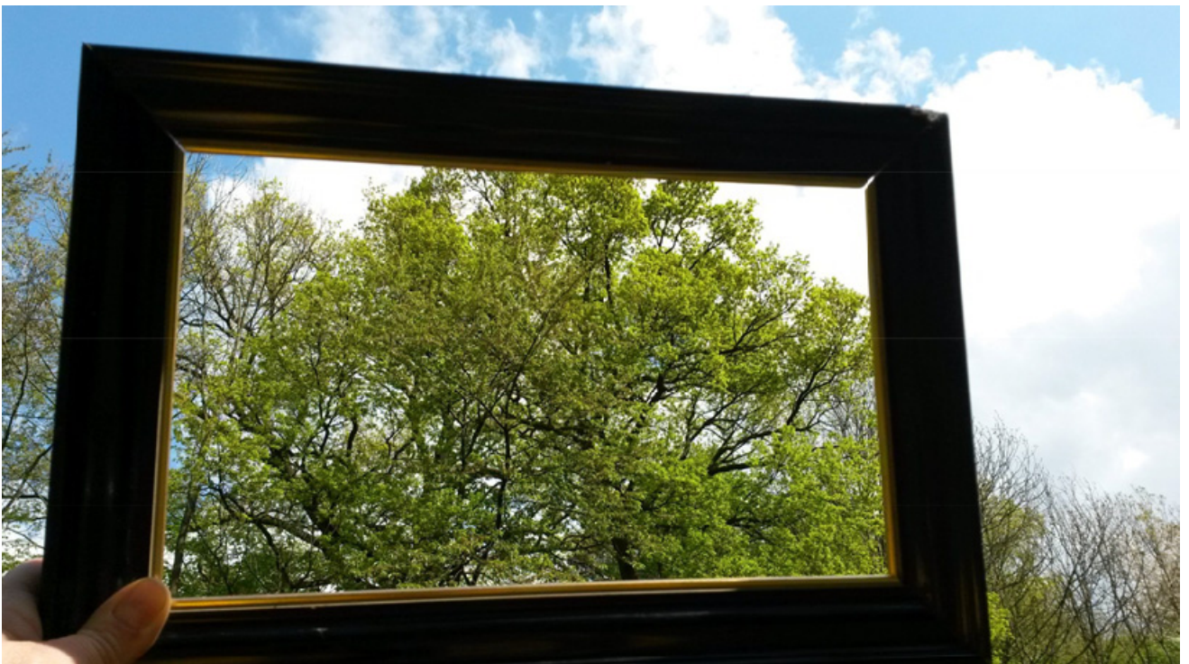
Baumkrone trifft Himmel