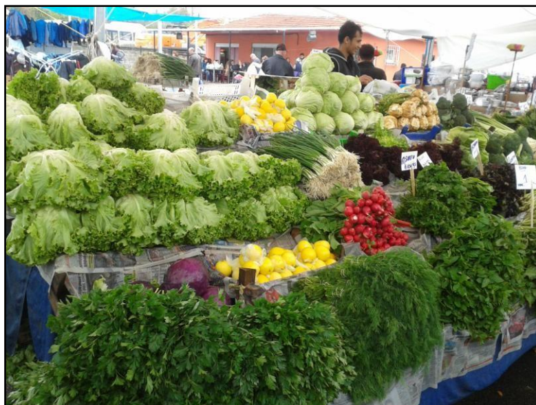
Markt in Göztepe – Salı Pazarı