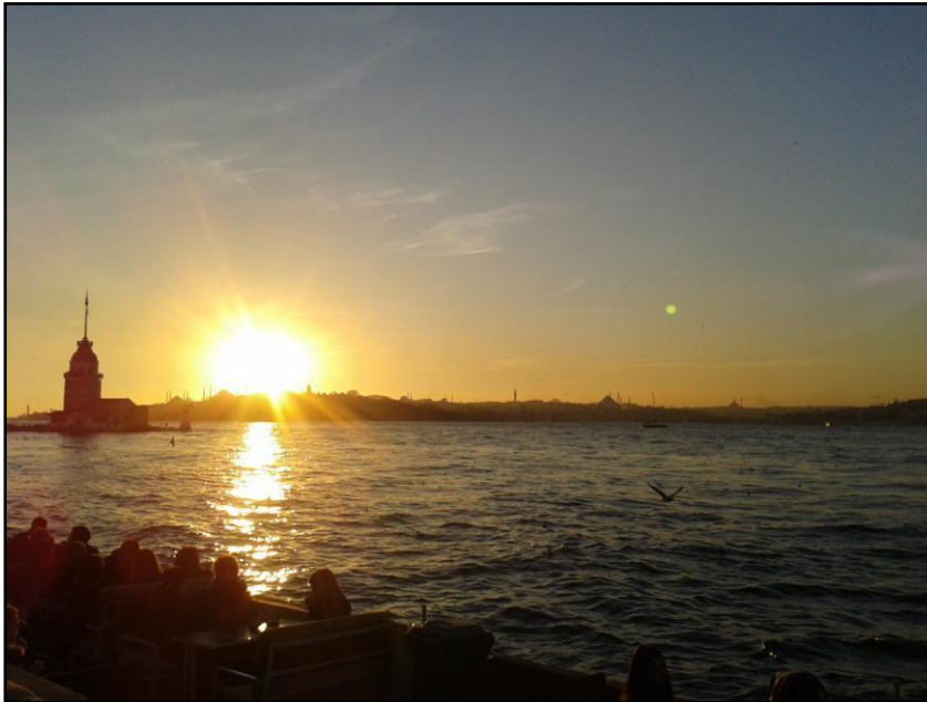
Sonnenuntergang am kiz kulesi in Üsküdar

Ich habe so viele wunderbare Menschen kennengelernt, so viel über mich selbst und auch dir Türkei gelernt und die Zeit in Istanbul sehr genossen. Ich kann jedem nur empfehlen, diese Chance zu nutzen.