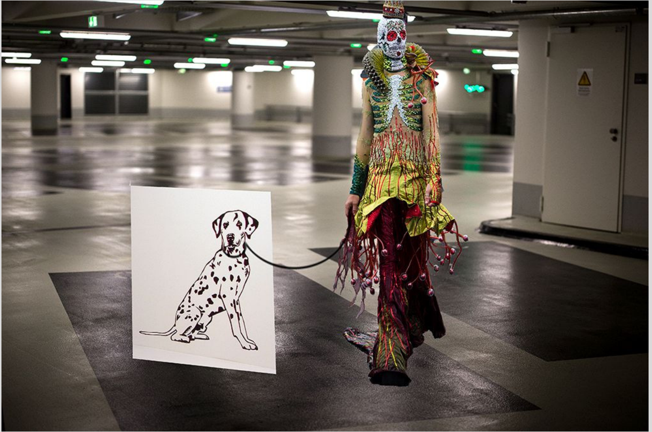
Urbane Unterwelten 5