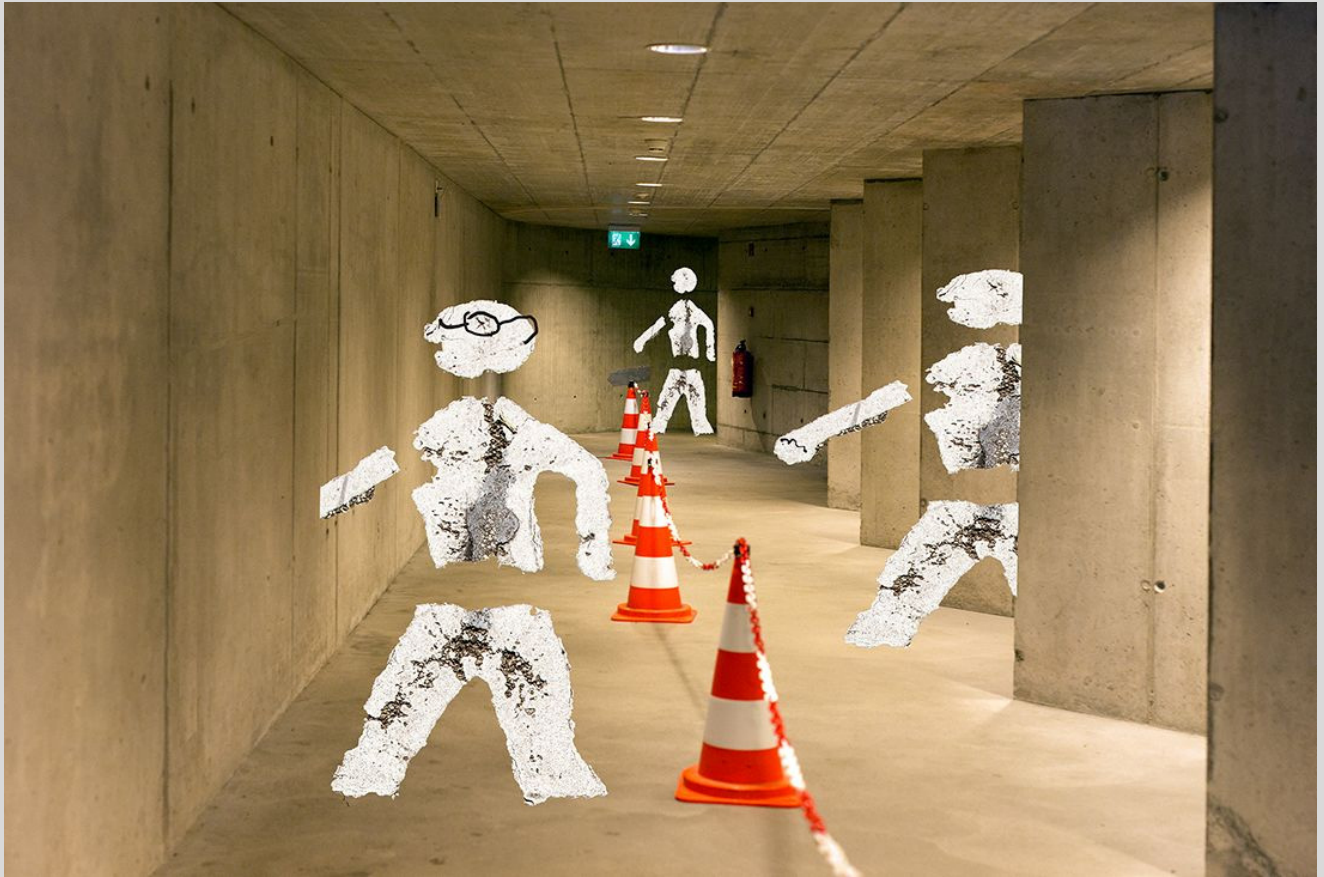
Urbane Unterwelten 3