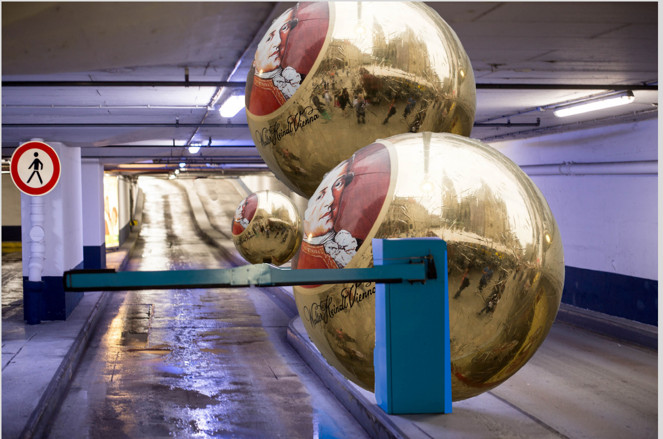
Urbane Unterwelten 4