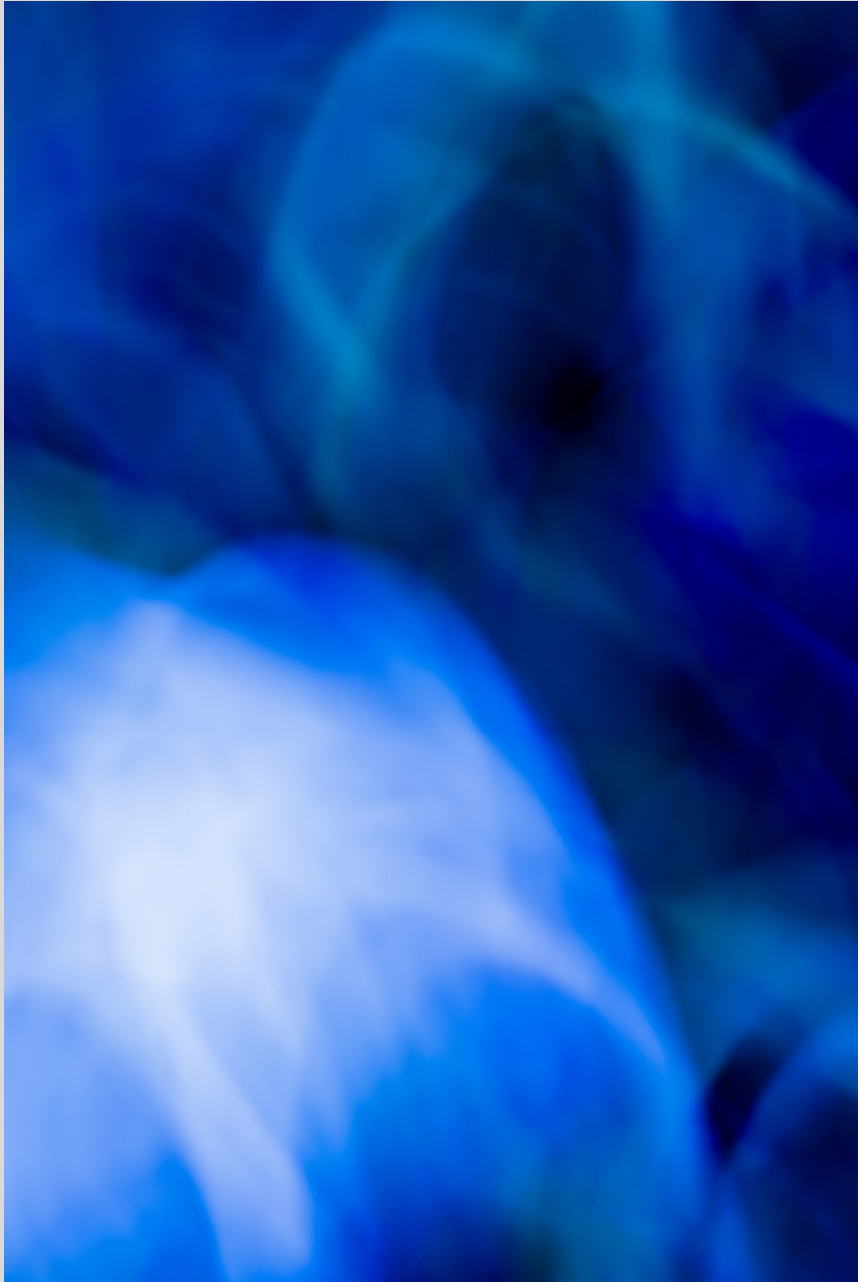
For You 10