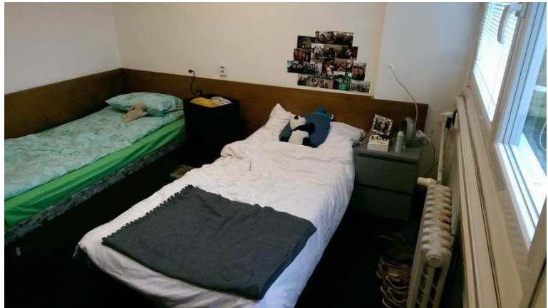
Ein Teil des Zimmers im Wohnheim

Wenn man lieber in einer Wohnung wohnen möchte, gibt es diverse Facebook-Gruppen und ähnliches, in denen man eine solche finden kann. Bei Freunden hab ich aber auch mitbekommen, dass man da etwas vorsichtig sein muss, da es häufiger vorkommt, dass gerade für Erasmusstudenten Wohnungen für einen deutlich höheren Preis angeboten werden. Ansonsten werden Wohnungen oft möbliert für bereits festgelegte Zeiträume vermietet.