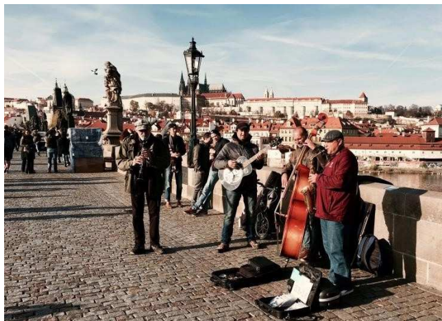
Auf der berühmten Karlsbrücke mit Prager Burg im Hintergrund

Prag hat auch optimale und vor allem preiswerte Verbindungen mit Fernbussen und Bahnen zu anderen tschechischen Städten und ins Ausland. Es lohnt sich immer für ein längeres Wochenende in die umliegenden Länder zu fahren, denn auch da gibt es natürlich unglaublich viel zu entdecken. Neben dem International Club der Universität gibt es auch noch andere Organisationen, die ganze Städtetrips für ein Wochenende anbieten. Empfehlen würde ich aber auch, sich ein bisschen in Tschechien selber umzusehen. In direkter Nähe zu Prag gibt es viel Natur, die zum Wandern einlädt. Ansonsten gibt es einige kleine, wunderschöne Städtchen, die sich für einen Tagesausflug eignen (z.B. Karlovy Vary). Bei der Bahn bekommt man mit größeren Gruppen auf Nachfrage einen Gruppenrabatt, dann werden die Tickets noch viel günstiger.