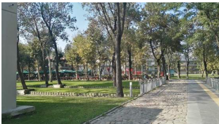
Auch im September und Oktober kann man das Grün des Santral Campus noch genießen ...

Erasmus-Studierenden konnte ich relativ problemlos meine Kurse belegen. Ich konnte zwar nicht alle Kurse aus meinem ersten Learning Agreement wählen, konnte aber die fehlenden durch andere ersetzen.