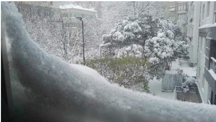
So viel Schnee ist in Istanbul nicht die Regel, dennoch sollten feste Schuhe und eine warme Winterjacke zur Ausstattung gehören.

gewohnt. Ortaköy ist eine eher ruhige Gegend mit Familien und älteren Menschen, welche am Fuß der ersten Bosphorus Brücke gelegen ist. Um zur Uni zu gelangen, habe ich einen der zahlreichen Buse bis nach Besiktas zur Haltestelle „Akaretler“ genommen und bin von da in den Shuttle Bus der Bilgi eingestiegen. Angenehm ist, dass die Bilgi in zahlreiche Viertel Istanbul kostenlose Shuttle Busse anbietet, die den Weg in die und von der Uni deutlich erleichtern. Die Abfahrtsorte und Zeiten sind auf der Internetseite der Uni einzusehen und können sich manchmal ändern, weshalb du öfter mal einen Blick draufwerfen solltest.