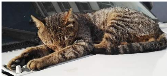
Und natürlich Katzen ...