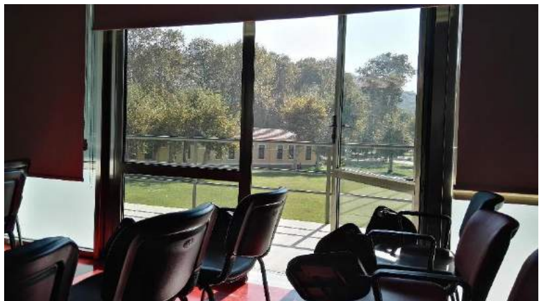
Klassenraum auf dem Santral Campus

Die Istanbul Bilgi University ist eine Art private Universität die durch eine Foundation - das Laureate International Universities Network - gegründet wurde. Es gibt auf der europäischen Seite drei Campi. Die Willkommens-Veranstaltung für Internationale Studierende und alle meine Kurse fanden auf dem Santral Istanbul Campus statt. Der Santral Campus ist auf der Fläche eines alten, ungenutzten Elektrizitätswerkes gelegen und weist demnach eine interessante Architektur auf. Der Campus ist überschaubar und ähnelt einem Park. Zwischen den Kursen können die Studenten in eines der Cafés gehen. Bei gutem Wetter lässt es sich auf den Wiesen vor den Gebäuden entspannen. Eine Bibliothek und Tische zum lernen sind vorhanden. Auch Anlaufstellen wie das Student Affairs Office oder