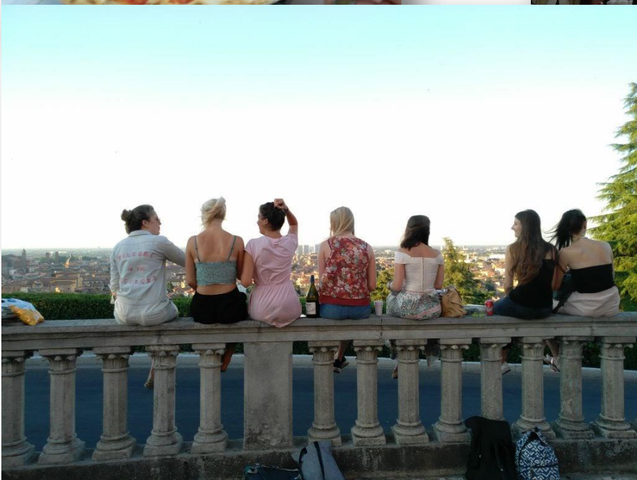
Blick auf die Stadt von San Michele in Bosco