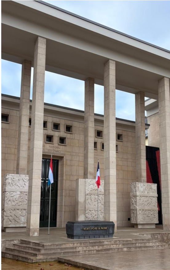
Außenansicht des Résistance-Museums