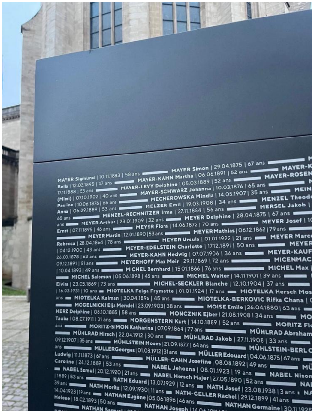
Namen jüdischer Luxemburger*innen, die zwischen 1940-1945 von den Nationalsozialisten ermordet wurden.