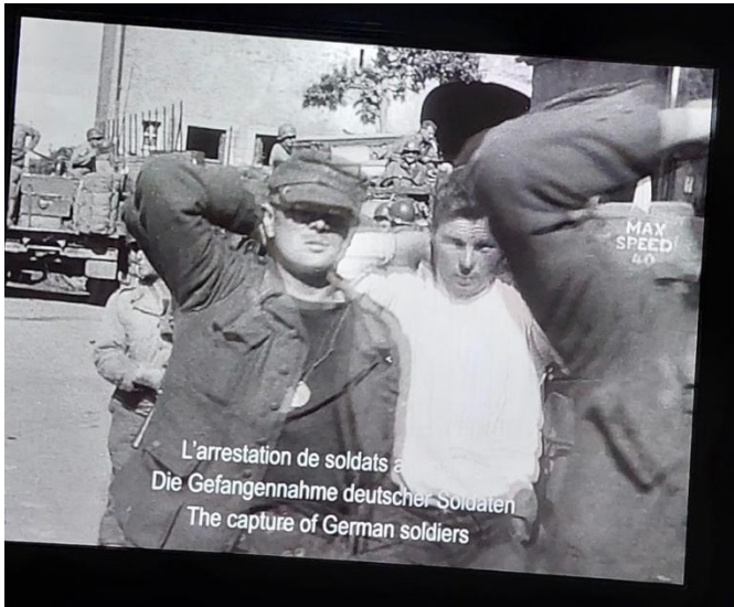
Filmausschnitt über die Gefangennahme deutscher Soldaten.