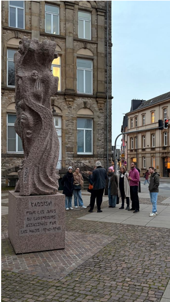
Kaddish: Für die jüdischen Mitbürger*innen Luxemburgs, die zwischen 1940-1945 von den Nationalsozialisten ermordet wurden.

(Informationsheft zum Shoah-Gedenkweg in Luxemburg Stadt)