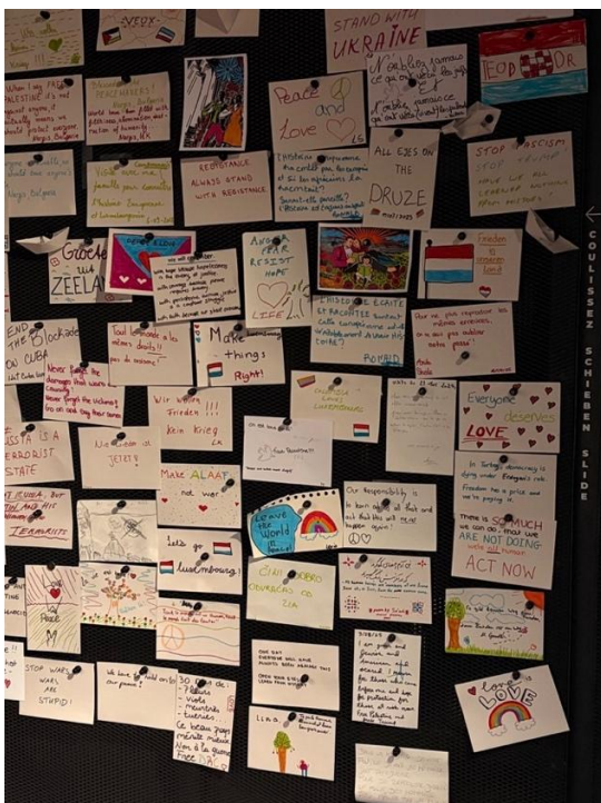
Briefe und Karten von Schüler*innen unterschiedlichster Herkunft zur heutigen weltpolitischen Lage.